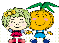
レタス たまねぎ サラちゃん サンちゃん